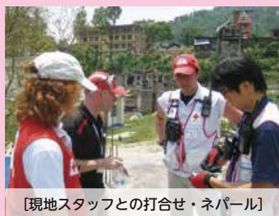
【現地スタッフとの打合せ・ネパール】

世界最大の赤十字ネットワークで、世界中の災害や紛争、病気などに苦しむ人々を救うため、緊急時の救援や復興支援、開発協力などを行っています。