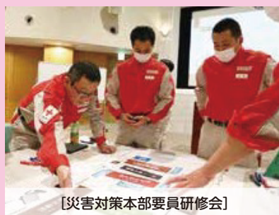
【災害対策本部要員研修会】