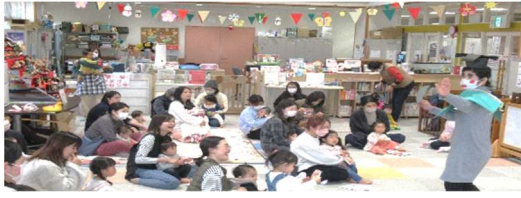
♪ 3月のたまっ子らんどおひな祭りの様子 ♪